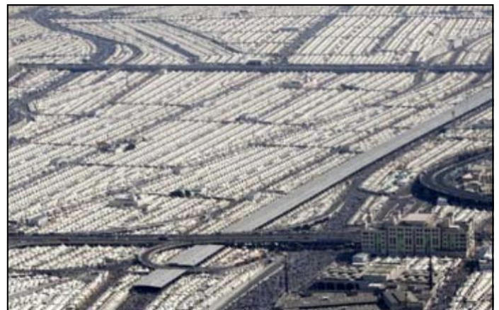
Mina, orașul corturilor

Kaaba conține o piatră neagră despre care se crede că a fost dăruită lui Avraam de către arhanghelul Gabriel, potrivit unora.** Alții spun că piatra pur și simplu a făcut parte din structura originală a Kaabei. În timpurile pre-islamice ( jahiliyyah – era ignoranței) Kaaba era un loc de pelerinaj ce adăpostea idoli. Potrivit tradiției, Mohammed a dedicat-o pentru închinarea la singurul Dumnezeu.