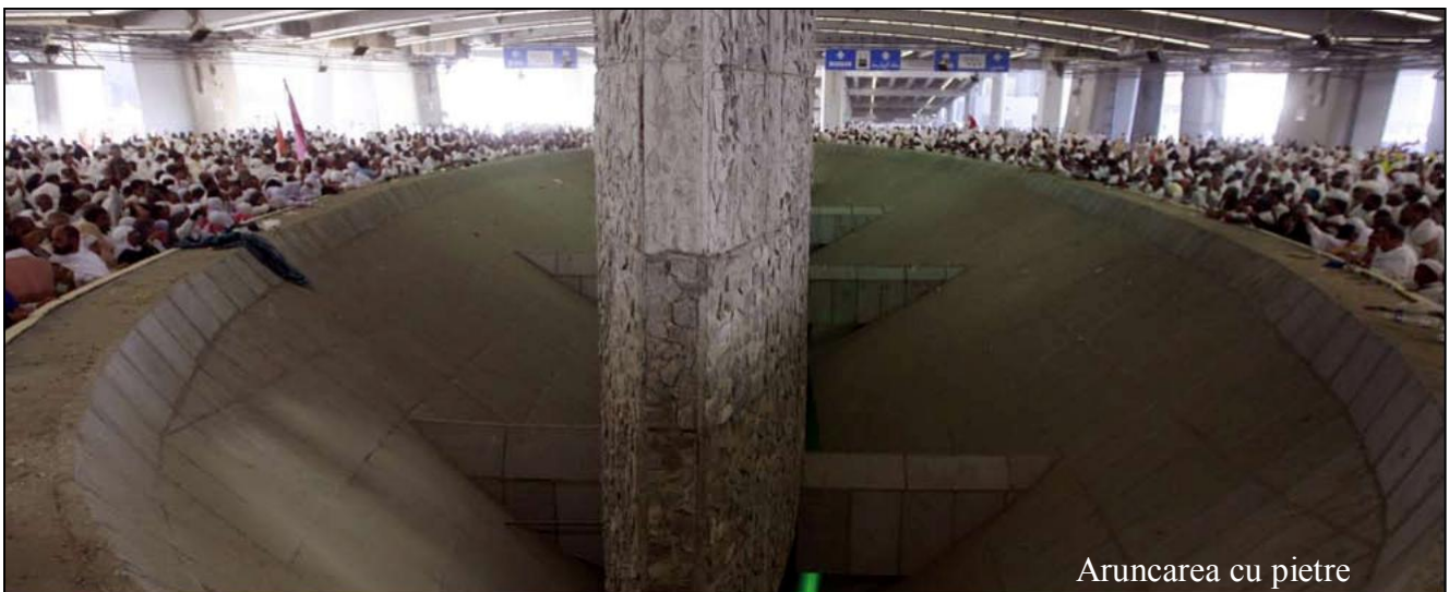
Aruncarea cu pietre